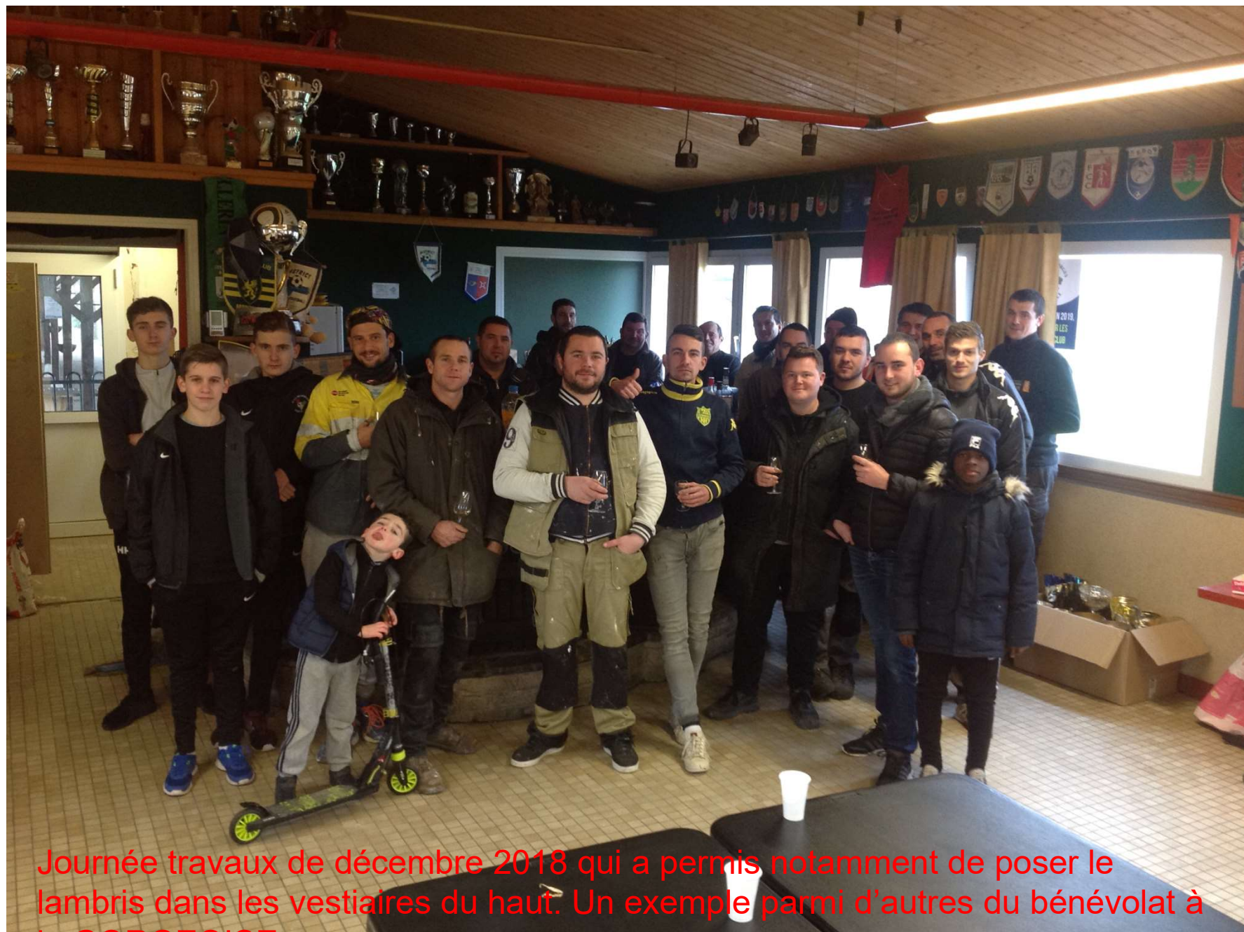
Journée travaux de décembre 2018 qui a permis notamment de poser le lambris dans les vestiaires du haut. Un exemple parmi d'autres du bénévolat à la GORGEOISE