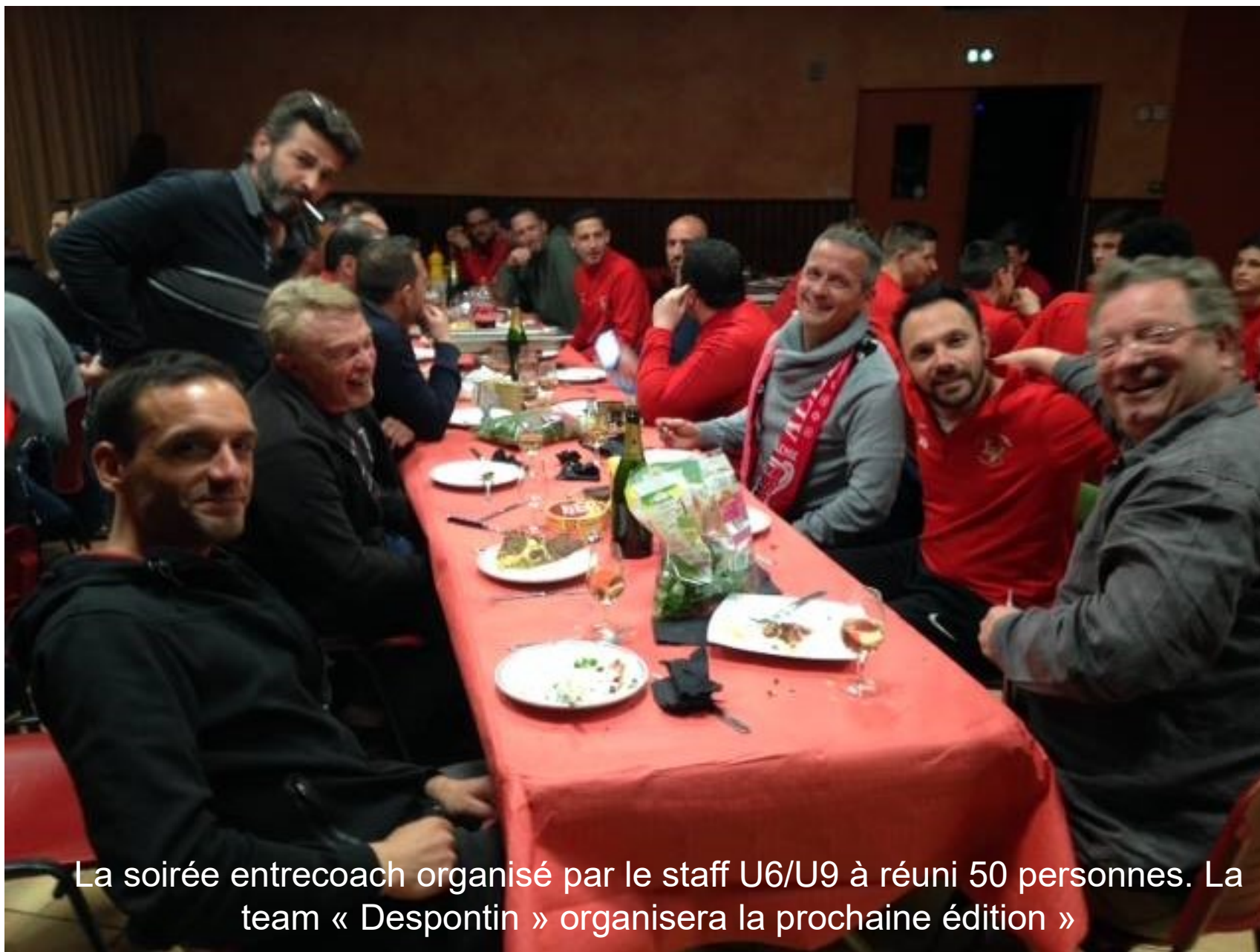
La soirée entrecouch organisé par le staff U6/U9 à réuni 50 personnes. La team « Despontin » organisera la prochaine édition »