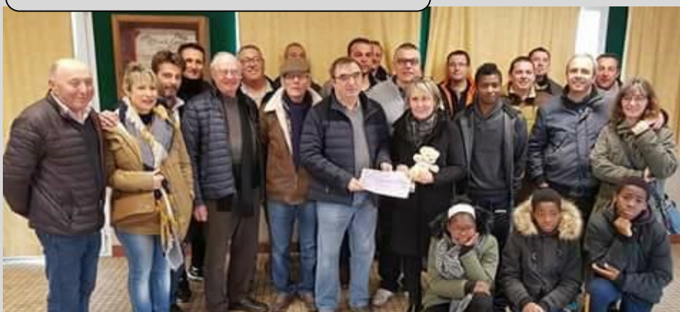
Remise du chèque en faveur des enfants défavorisés d'Haiti