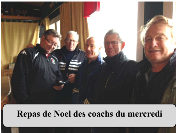
Repas de Noel des coaches du mercredi