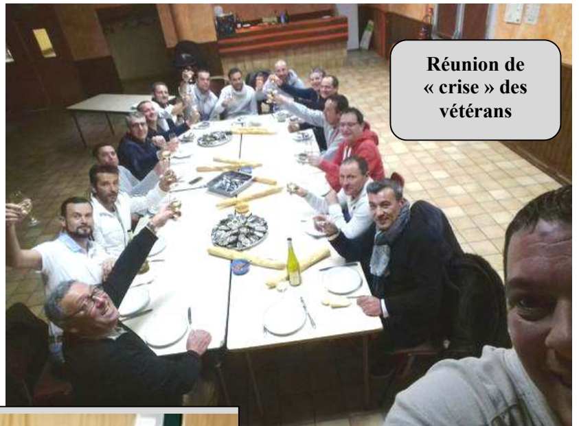
Réunion de « crise » des vétérans