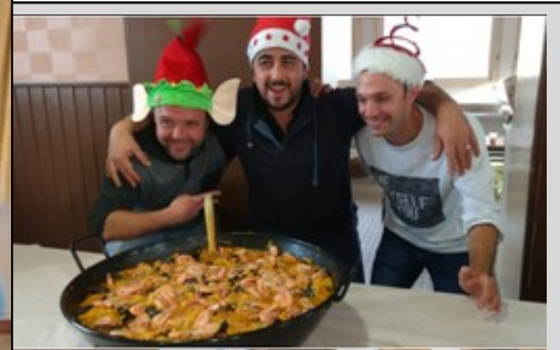
Le Noël des Loisirs