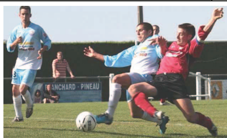
Au Cœur de l'Élan - Novembre 2010