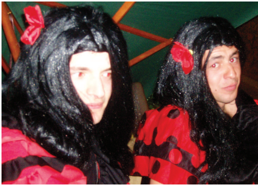
Merci aux « espagnolettes » (ci-dessus) et à l'équipe d'organisation au grand complet (ci contre) pour leur accueil.

Comment peut-on qualifier le déroulement de cette soirée ? Festive, joviale et bien arrosée ? En tout cas, ce sont les premières impressions qui sont ressorties de la bouche des principaux acteurs ! Tout d'abord, félicitons toute l'équipe des festivités pour la réussite de la soirée du foot. En effet, plus de 300 repas ont été servis lors de ce nouveau concept. Accueilli par deux charmantes « espagnolettes » (cf photo plus bas), un verre de Sangria vous attendait pour bien débiter les réjouissances. Puis après quelques bavardages et confabulations, chacun s'installait à table pour écouter les premiers fredonnements du groupe Graffiti. Ensuite, la troupe « du Soleil dans la cuisine » fut rapidement mise à contribution pour déguster sa fameuse paëlla accompagnée de vins de terroirs diversifiés. Inaugurée par un Jacques H. des grands soirs, la piste fut prise d'assaut par d'innombrables danseurs. Puis après avoir dégusté fromages et gâteaux, un raz de marée se dirigeait vers le bar où un nombre pharaonique de verres furent vidés dans une bonne ambiance ! Pour couronner le tout, une soirée du foot ne se termine jamais sans anecdote : certain en oubliait même leur copine (pauvre Sonia !), d'autres couraient après des voitures pour qu'on les ramène chez eux vers 5h du matin pour boire du muscadet dans leur garage... Bref, la soirée est passée très voire trop vite pour beaucoup de personnes... On mettra cela sous le compte du décalage horaire.