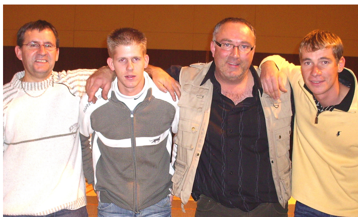
Les deux équipes finalistes du tournoi principal